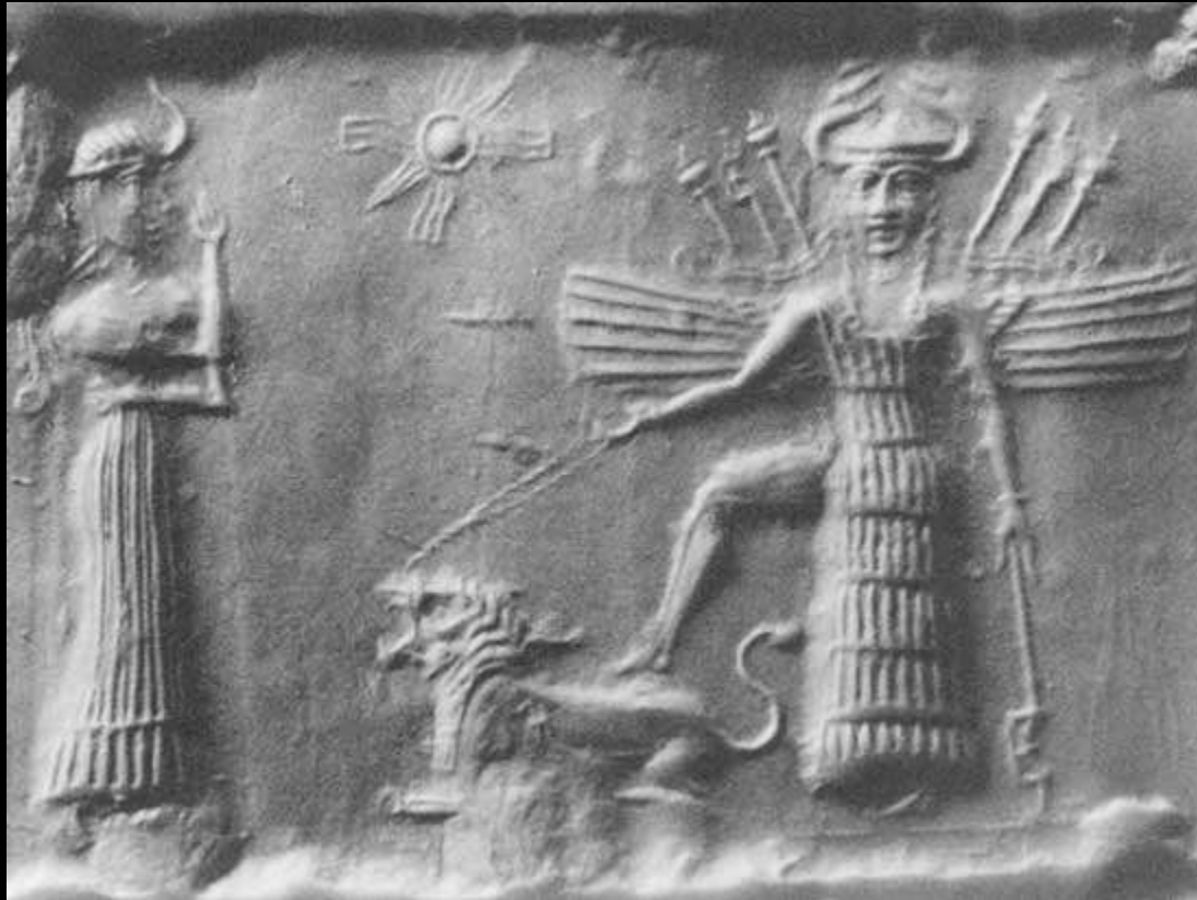
Referências estéticas – “Nana e o Mundo dos Mortos” Leonard Almeida