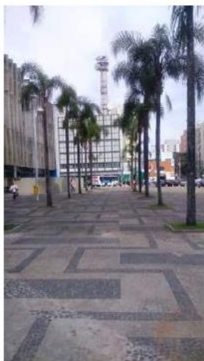
Mosaico do Paço Municipal e calçamento no entorno