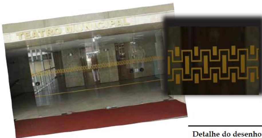
Detalhe do desenho nas portas do TMSA