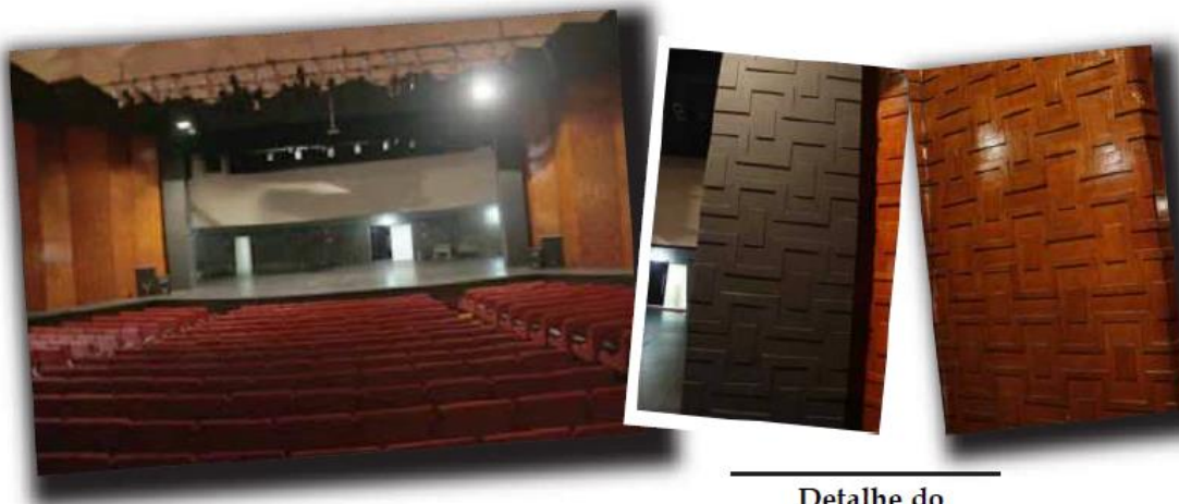
Detalhe do desenho nas laterais do palco do TMSA