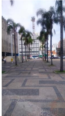
Mosaico do Paço Municipal e calçamento no entorno