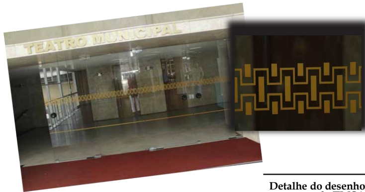
Detalhe do desenho nas portas do TMSA