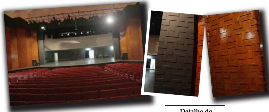
Detalhe do desenho nas laterais do palco do TMSA