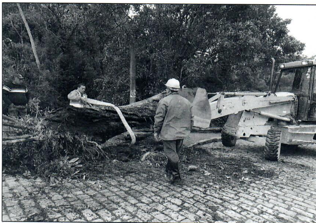
Fotos 3 e 4 – retirada e transporte da árvore até o galpão das oficinas