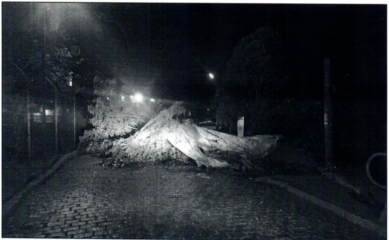
Fotos 1 e 2 – Registro do ocorrido em 21/10/22 e providências adotadas pela GCM