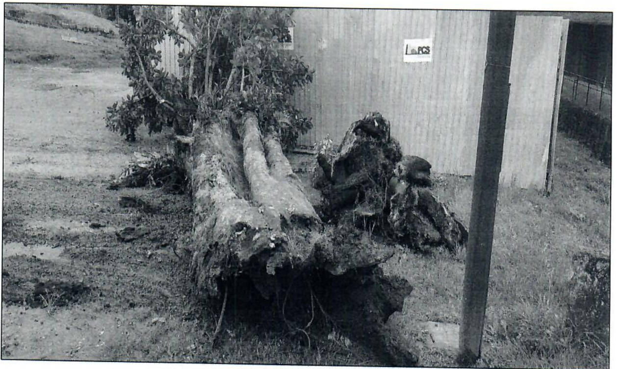
Fotos 9 e 10 – Madeira da árvore disposta nos galpões das oficinas