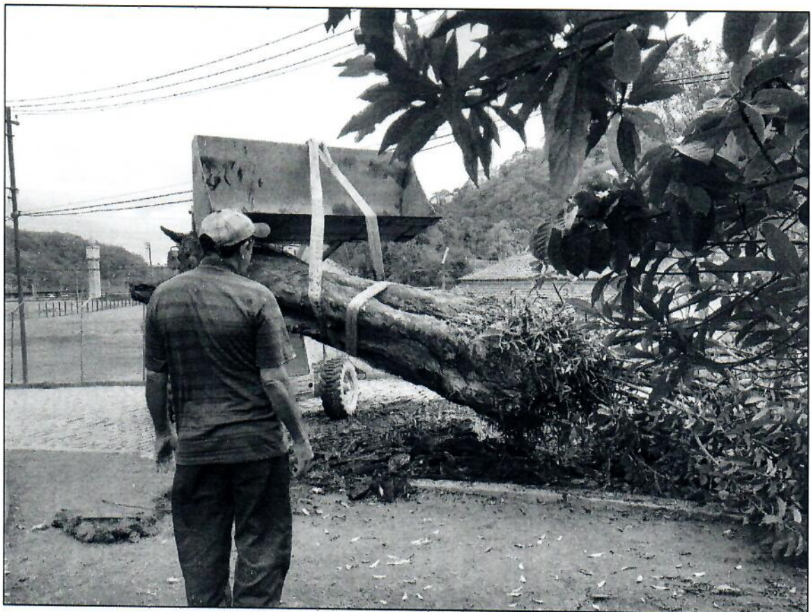
Fotos 7 e 8 – retirada e transporte da árvore até o galpão das oficinas