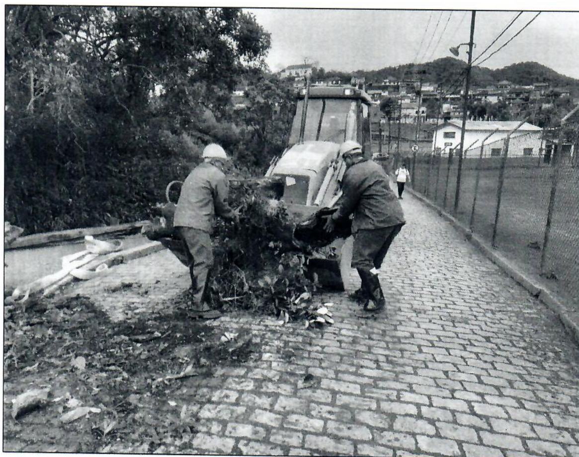
Fotos 5 e 6 – retirada e transporte da árvore até o galpão das oficinas