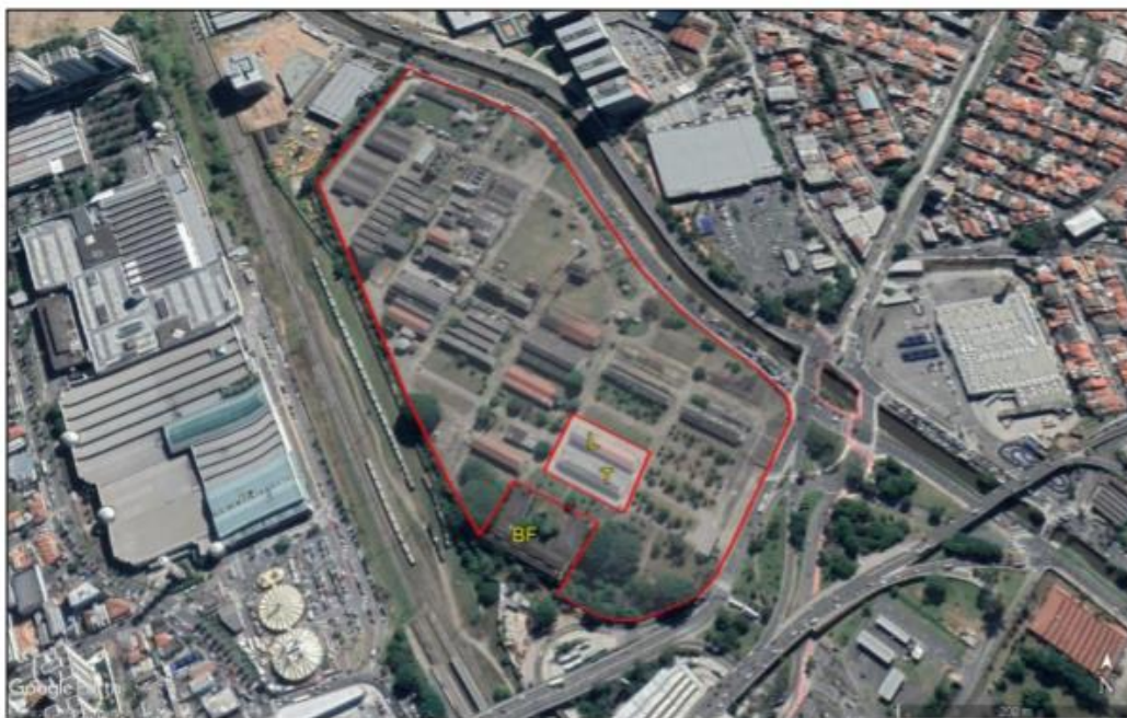
Lote da antiga Rhodia, em Santo André, SP. Em destaque, de forma esquemática, os pavilhões “L” e “T” e arruamento protegido, 2021. Reprodução do Google Earth.

Não há como negar a importância desse conjunto para a memória da cidade, uma vez que: