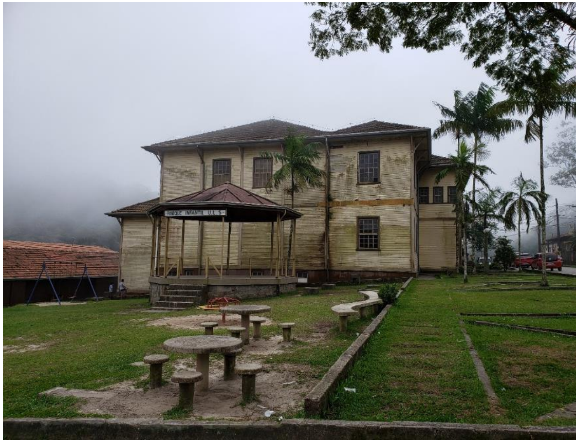
Figura 2 – Identificação do imóvel – Fachada Sul , local onde haverá o escoramento. Fonte: Suzana Kleeb – março de 2020

A Prefeitura de Santo André por meio da Secretaria de Meio Ambiente contratou a Formarte Projeto e Produção e Assessoria para o serviço especializado de arquitetura e para elaboração dos projetos básicos de arquitetura, restauro e complementares do imóvel, por meio do contrato 157/20 PJ.