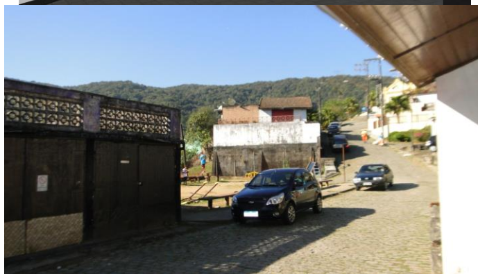
Visualização do impacto dos elementos instalados.