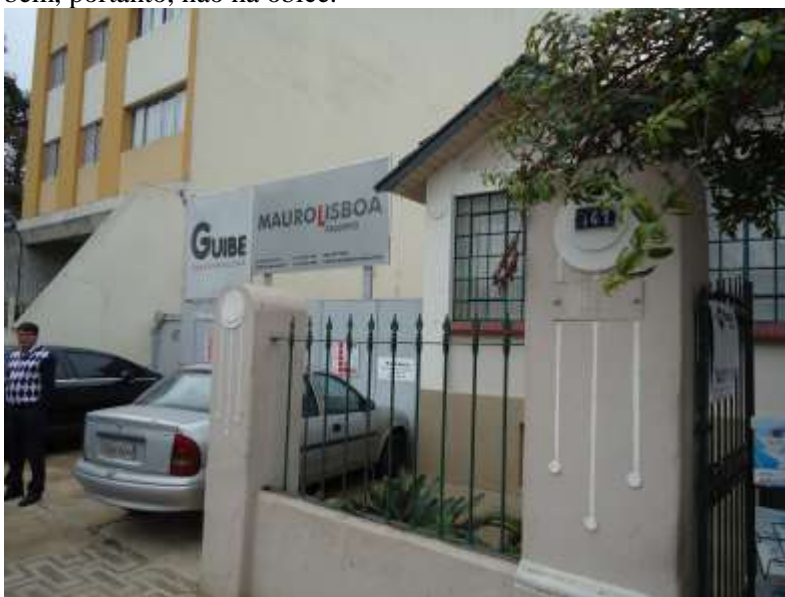
Figura 1 – imagem de 2011, notar piso externo em cimentado rústico.

Quanto à troca do piso externo, trata-se de um piso instalado na ocasião da construção do edifício anexo, anteriormente o piso era cimentado rústico. A proposta ora apresentada é a de instalação de porcelanato rústico antiderrapante na cor concreto, acreditamos que tal alteração no piso não interferirá significativamente no que se pretendia preservar com o tombamento do bem, portanto, não há óbice.