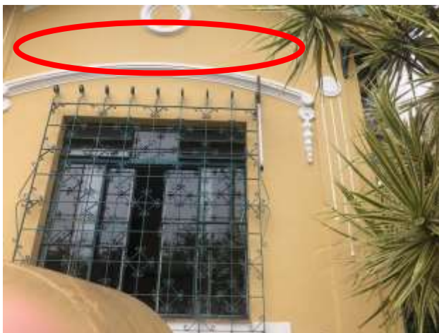
Figura 3 – novo local proposto para a instalação.

Quanto à instalação de placa de identificação acreditamos que o local agora proposto não é o melhor, haja vista que interferirá na percepção da fachada e em sua leitura, além do que, já haverá um totem de identificação bem próximo do local proposto, portanto, cremos que não é o ponto mais adequado para a instalação. Quanto ao letreiro na fachada posterior, não há óbice, mas, lembramos ainda que além de atender as regras do tombamento para instalação de publicidade, o interessado deverá atender também a Lei 6.748/1990 e Decreto 16.076/2010.