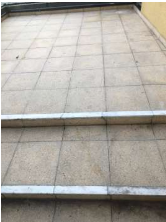
Figura 2 – piso externo atual, a ser trocado.

Secretaria de Cultura e Turismo Conselho Municipal de Defesa do Patrimônio Histórico, Artístico, Arquitetônico-Urbanístico e Paisagístico de Santo André COMDEPHAAPASA