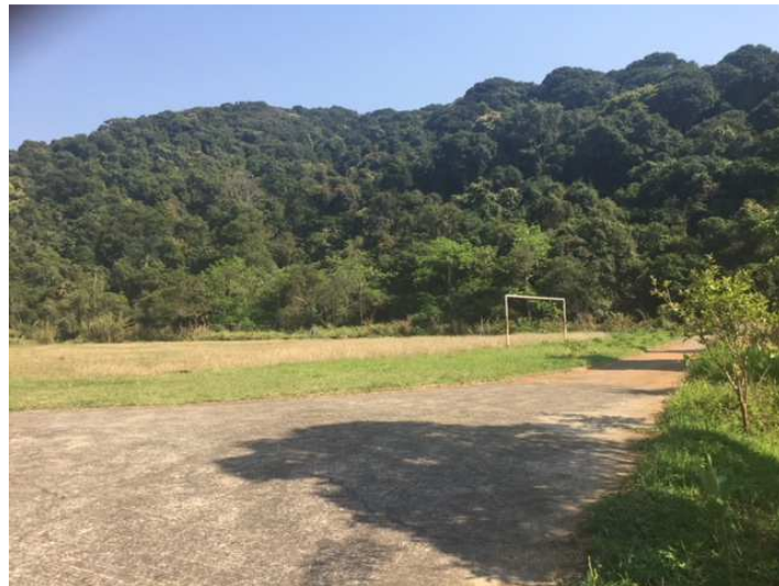
Campo de futebol – grade enferrujada