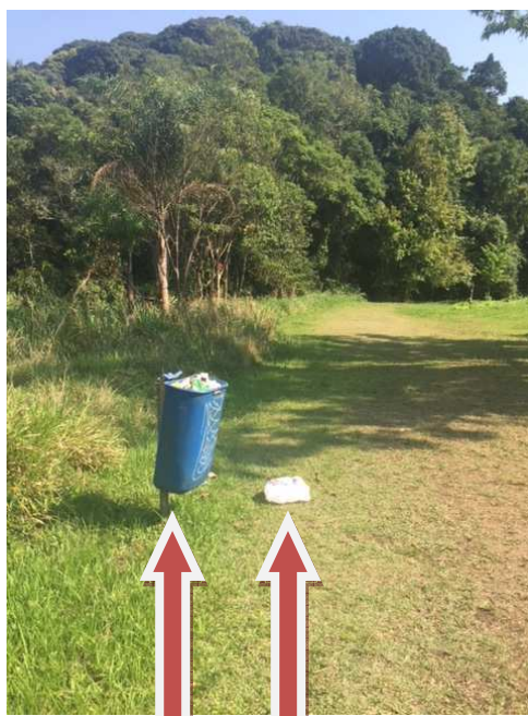
Lixeira quebrada e cheia. Lixo no solo.