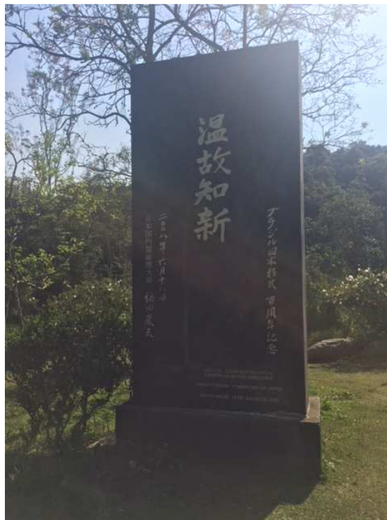
Takkon 01 em granito negro