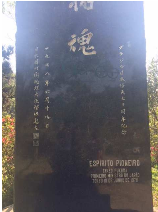
Takkon 02 em granito negro.