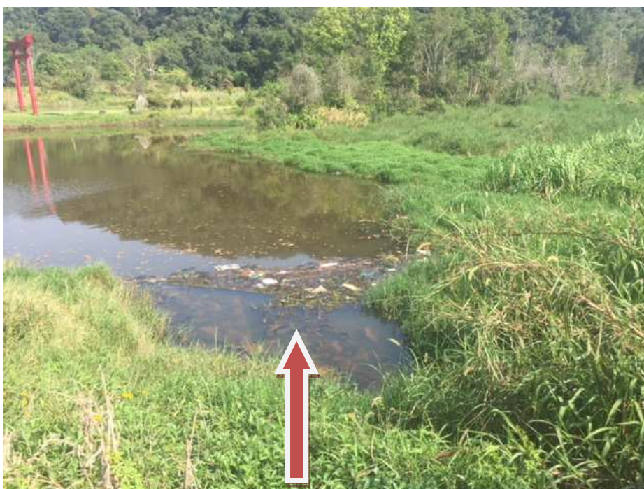
Lago – observa-se sujeira por todo lago, principalmente nas margens