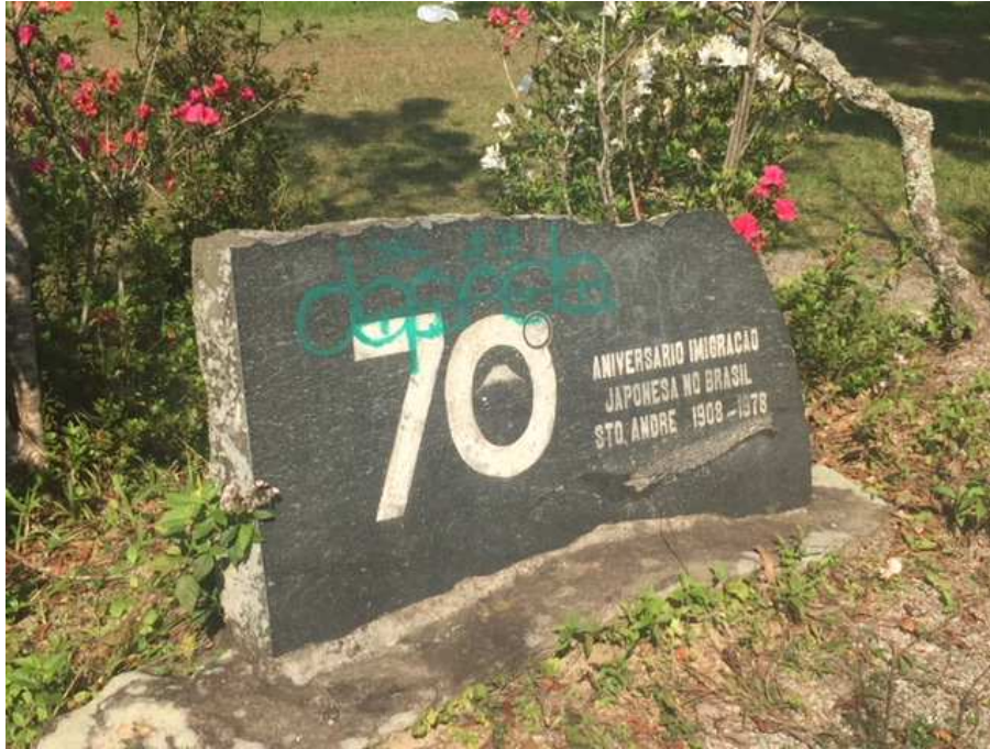
Placa comemorativa aos 70 anos de imigração japonesa em Santo André.