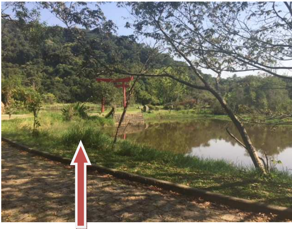
Lago – observa-se mato alto próximo a margem do lago