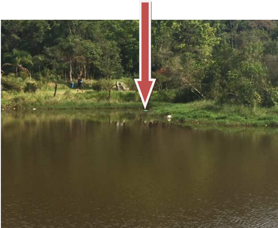
Lago – observa-se sujeira por todo lago, principalmente nas margens