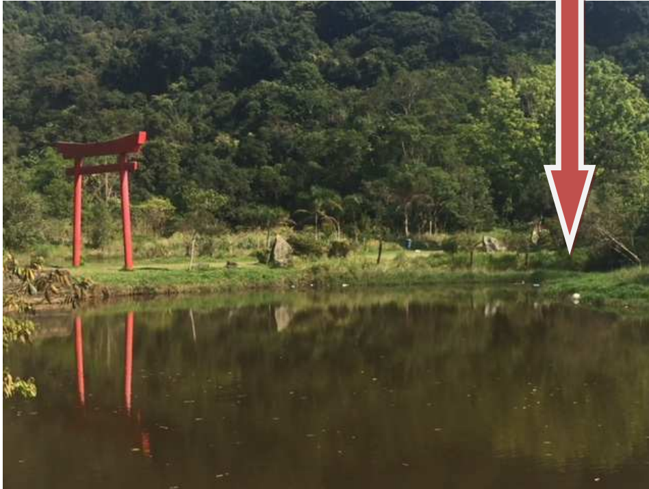
Lago – observa-se sujeira por todo lago, principalmente nas margens