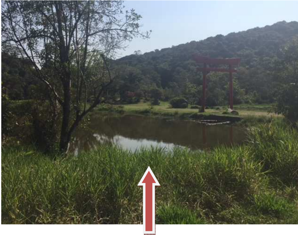
Lago – observa-se mato alto próximo a margem do lago