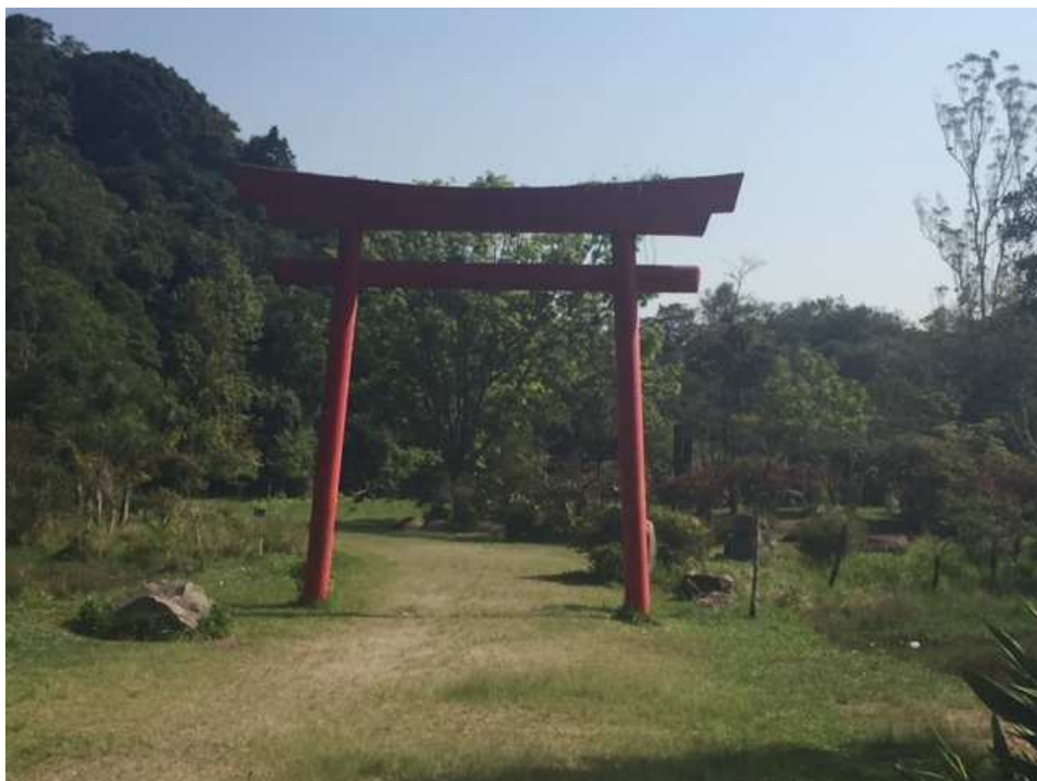
Tori. Há vegetação sobre esse elemento e a pintura encontra-se desgastada