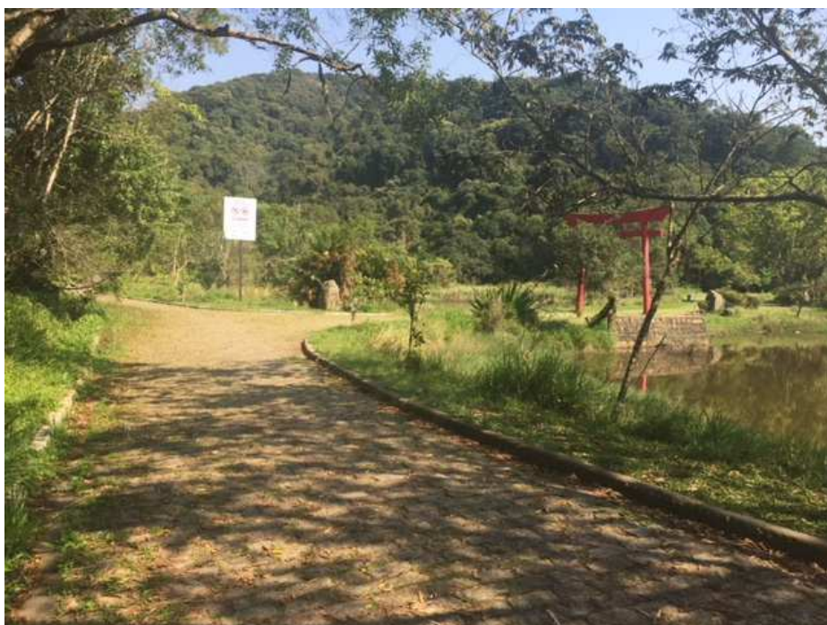
Caminho que leva ao Tori. Necessário manutenção