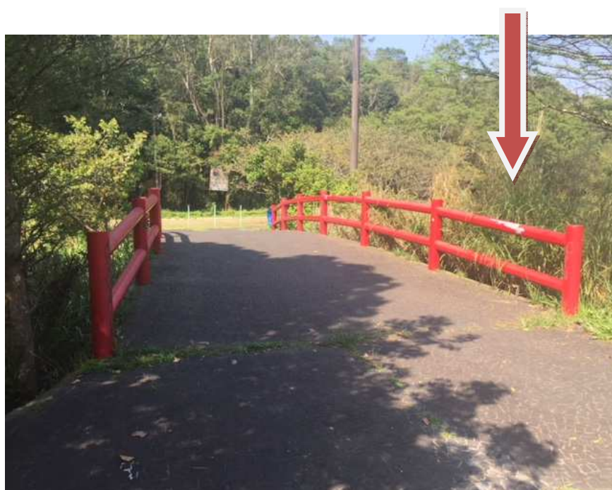
Ponte de amizade – necessita pintura