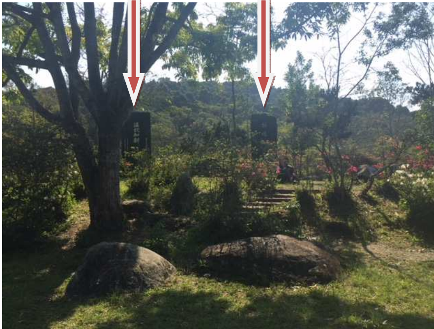
Foto com os dos Takkon em granito negro ao fundo

DOIS TAKKON EM GRANITO NEGRO; DUAS PLACAS COMEMORATIVAS (UMA EM HOMENAGEM AOS SETENTA ANOS DA IMIGRAÇÃO JAPONESA NO BRASIL); OUTRA REFERENTE AOS CEM ANOS; UMA REFERENTE AOS LAÇOS DE AMIZADE; OUTRA REFERENTE AO MARCO DOS LAÇOS DE AMIZADE E OUTRA REFERENTE A PONTE DA AMIZADE.