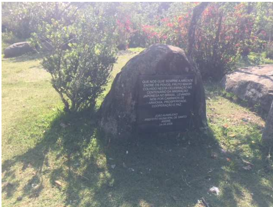
Placa comemorativa de laços de amizade/100 anos (2008)