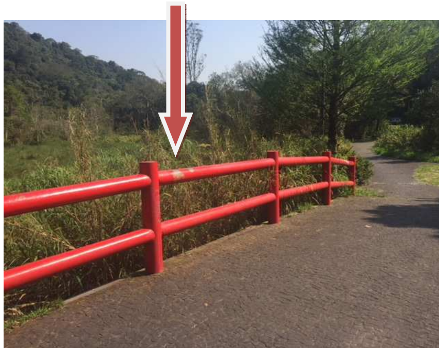
Ponte de amizade – necessita pintura