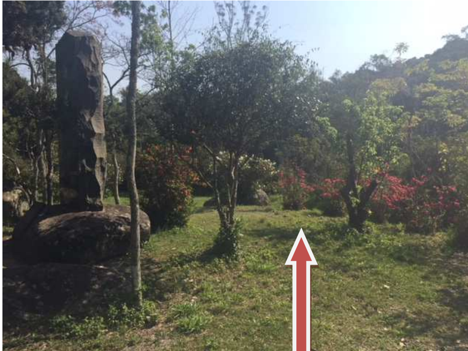
Jardim – necessário manutenção e poda