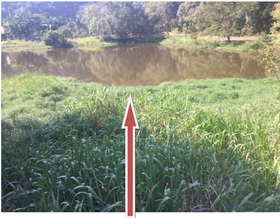
Lago – pode-se observar muito mato adentrando o lago