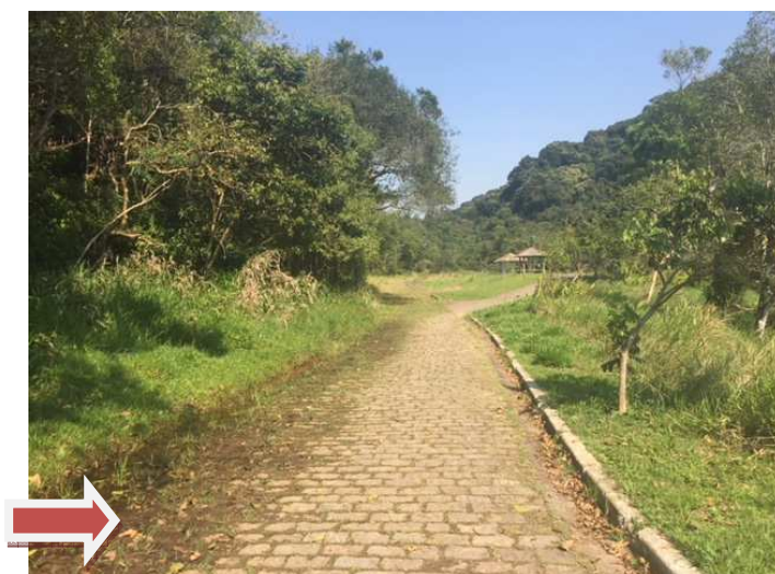
Acúmulo de águas no caminho.