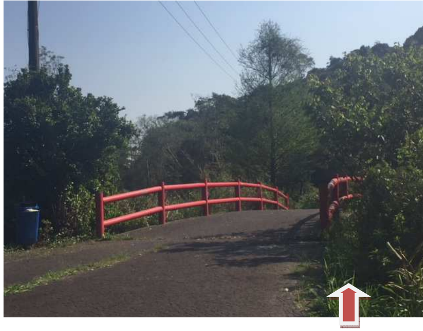
Ponte da amizade – necessário capinagem próximo ao local