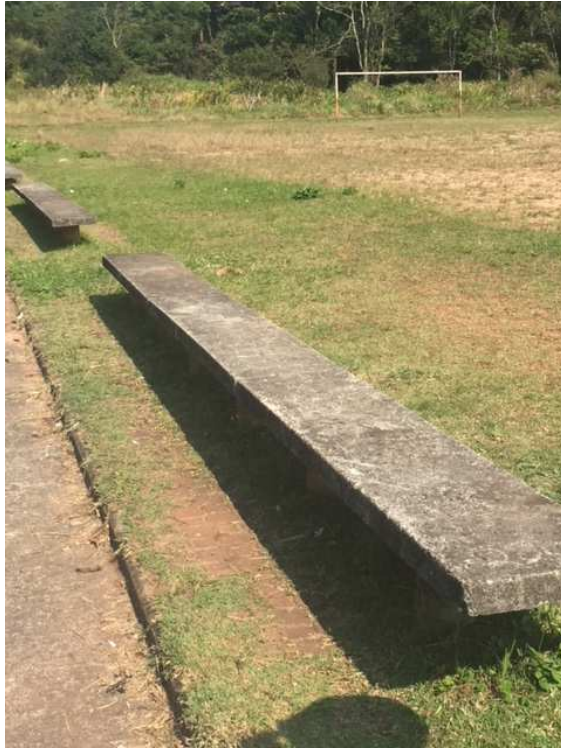
Banco do campo de futebol necessita reparos