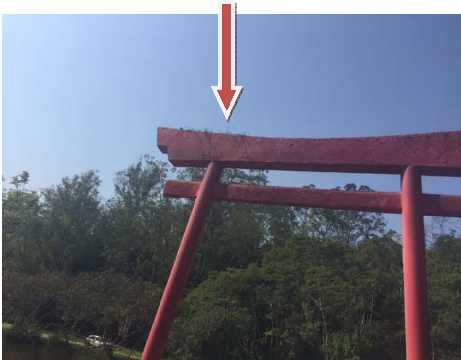
Torii – vegetação crescendo sobre o elemento superior e necessidade de pintura