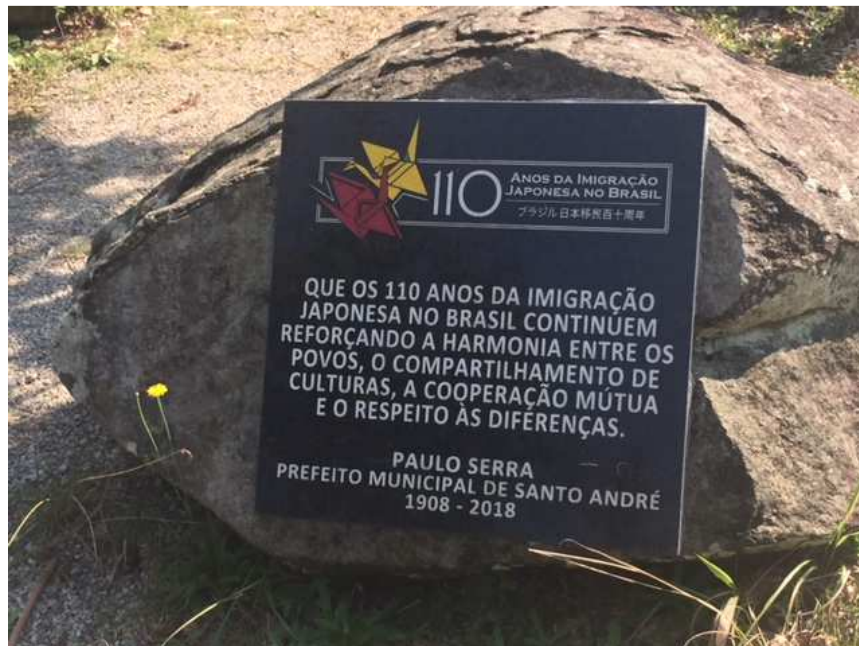
Placa nova comemorativa referente a 110 anos da imigração japonesa no Brasil.

Sua instalação não foi solicitada/autorizada pelo COMDEPHAAPASA.