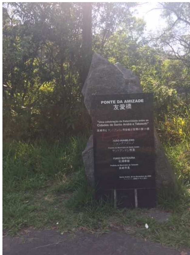
Placa comemorativa – referente a ponte da amizade.