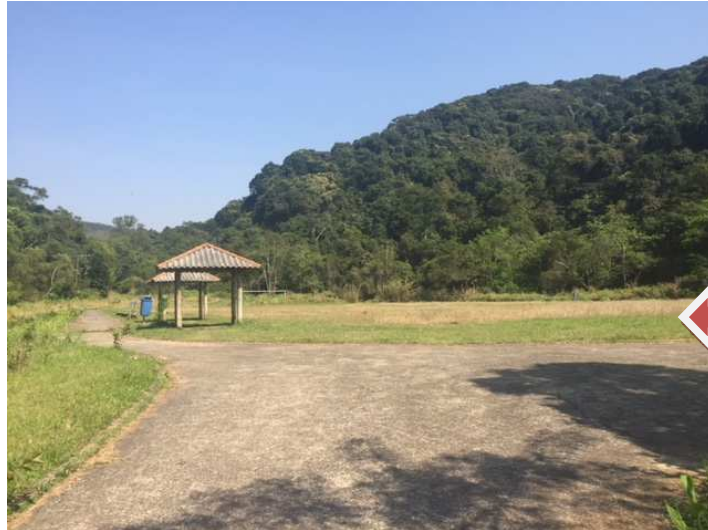
Campo de futebol com grama alta