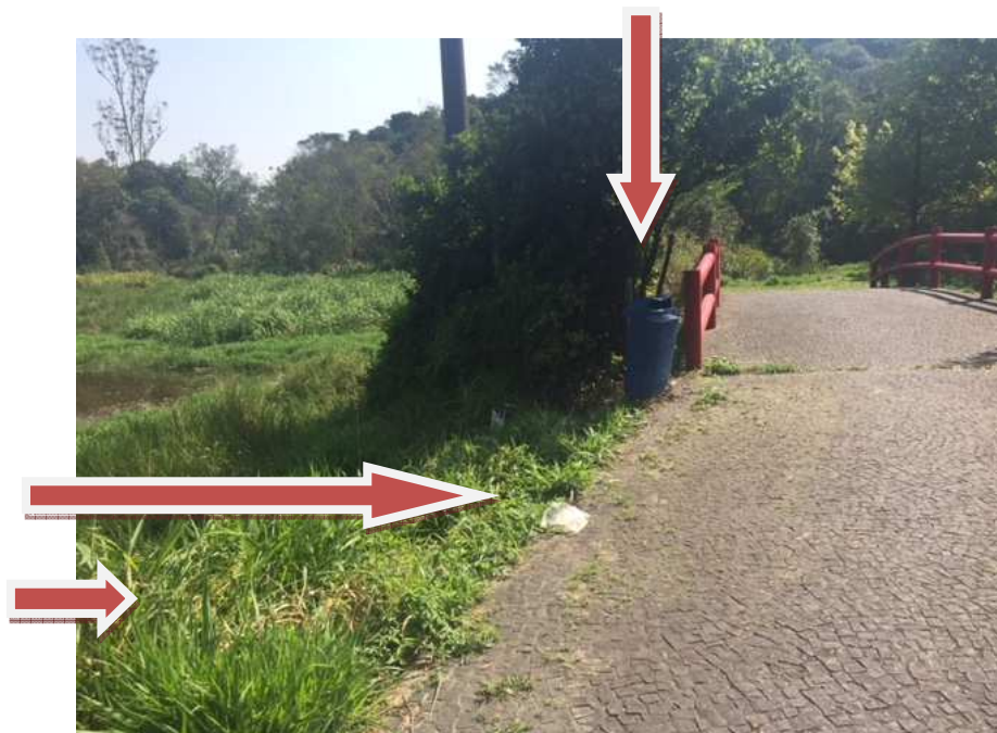
Ponte a amizade – observa-se lixeira quebrada, lixo no chão e mato alto.