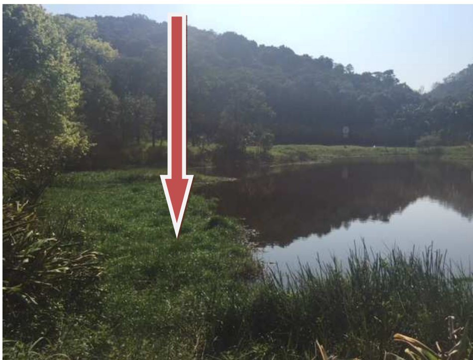
Lago – pode-se observar muito mato adentrando o lago