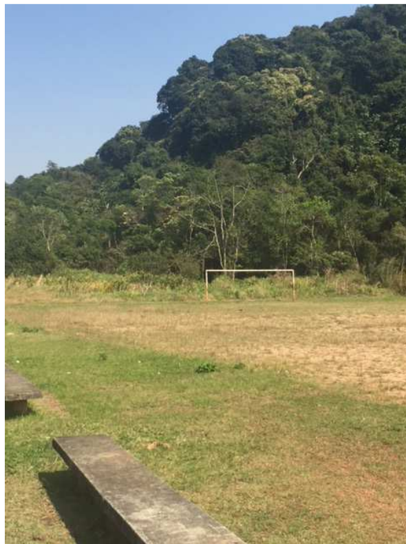
Campo de futebol necessita manutenção