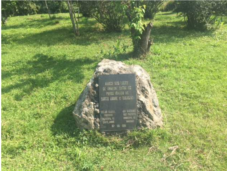
Placa comemorativa – marco dos laços de amizade entre os povos irmão de Santo André e Takasaki