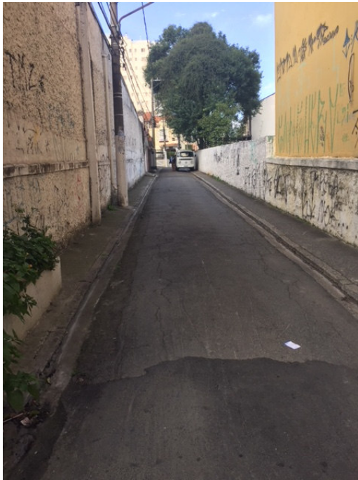
Travessa Adonias Filho (Foto 13)