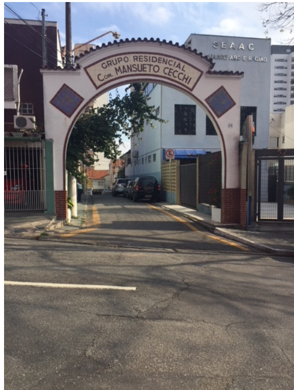
Pórtico – Av. João Ramalho, 68 – Frente (Foto 01)