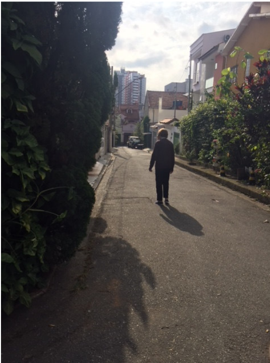
Travessa Utrillo ( Foto 09)