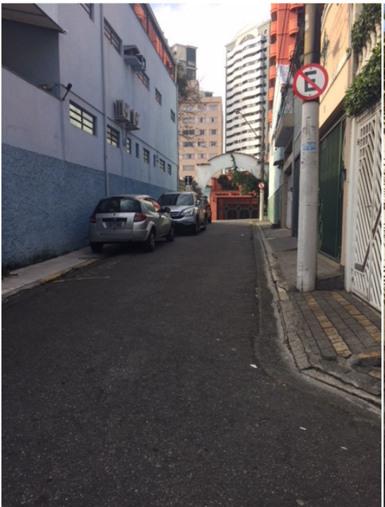
Travessa Azevedo Marques (Foto 11)