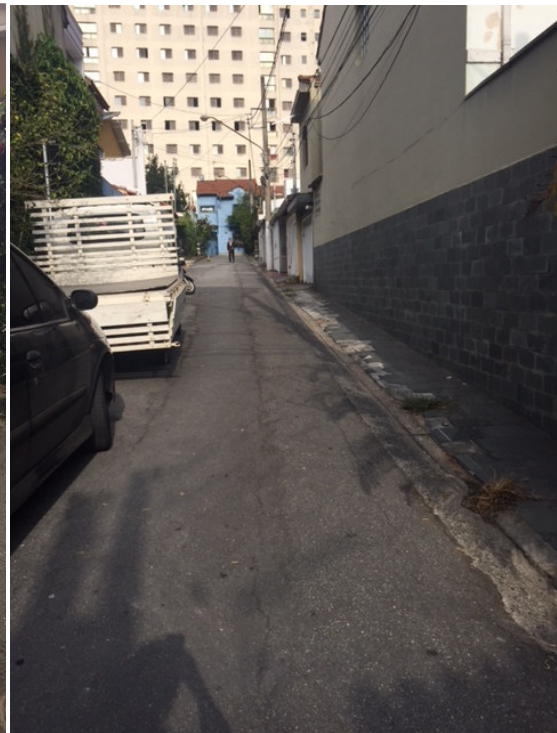
Travessa Utrillo (Foto 10)