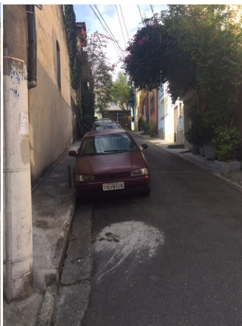
Travessa Utrillo (Foto 08)