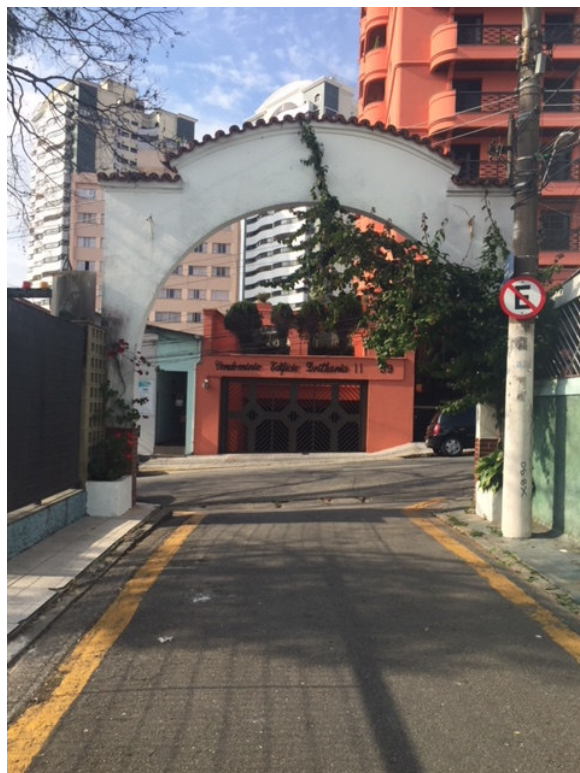
Pórtico – Av. João Ramalho, 68 – fundos (Foto 02)