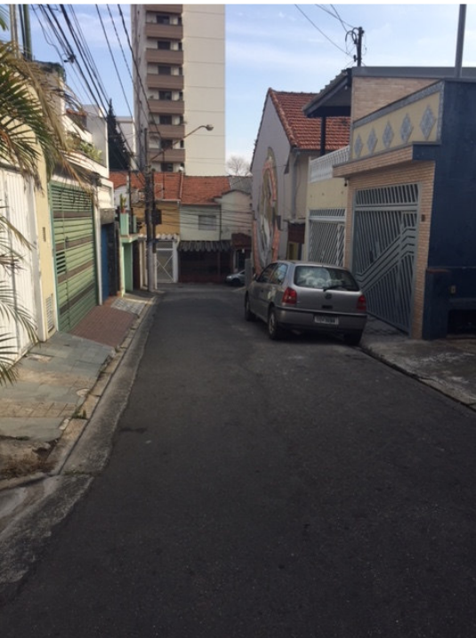
Travessa Azevedo Marques (Foto 12)