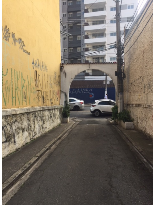
Pórtico – Rua Coronel F. Prestes, 617 – Fundos (Foto 06)

Com relação ao item 2,3 e 4 temos a informar que não observamos englobamento de lotes, bem como não houve mudança no desenho do arruamento, nem alteração nas larguras das calçadas. O gabarito (altura) das edificações é o mesmo verificado na vistoria que resultou no tombamento do bem. Segue abaixo fotos destes elementos.