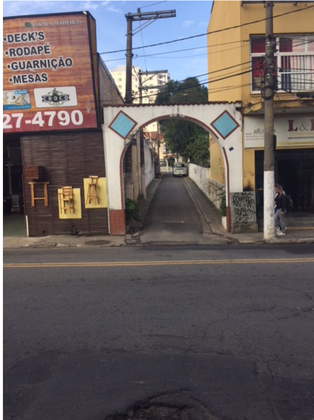
Pórtico – Rua Coronel F. Prestes, 617 – Frente (Foto 03)

Problemas na alvenaria, pintura e revestimento cerâmico.