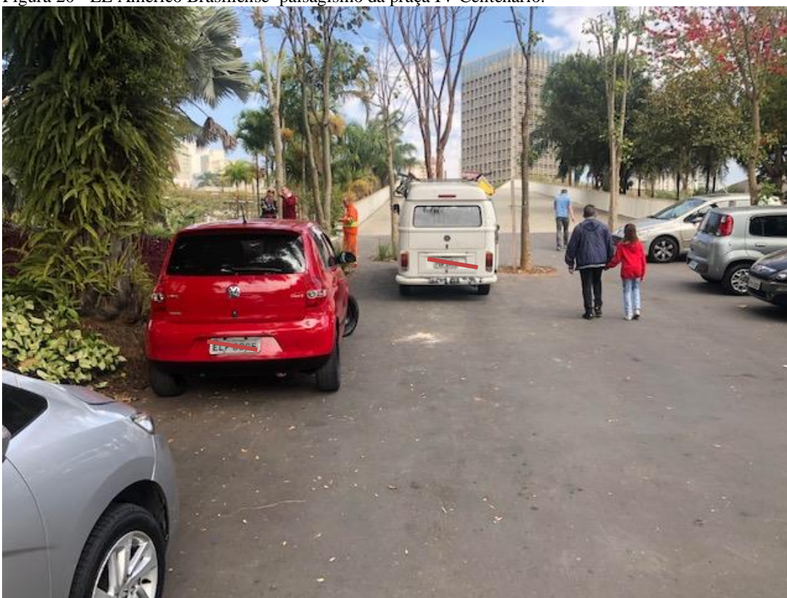
Figura 21 - Início da passarela Luso-brasileira com veículos estacionados em local proibido.