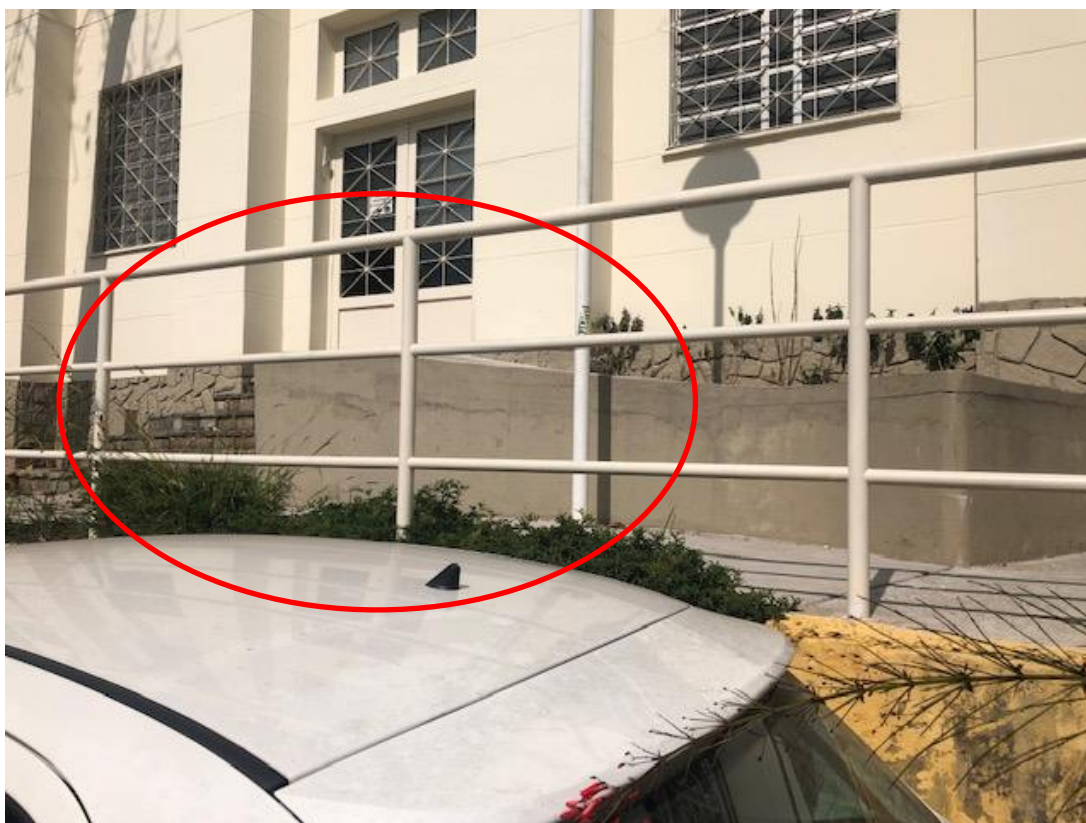
Figura 12 - Rampa executada sobre parte da escada do prédio dos Correios.