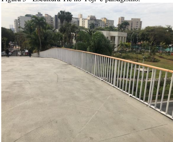
Figura 7 - Vista da passarela e Praça IV Centenário.