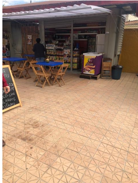
Figura 16 - Banca com venda de alimentos.