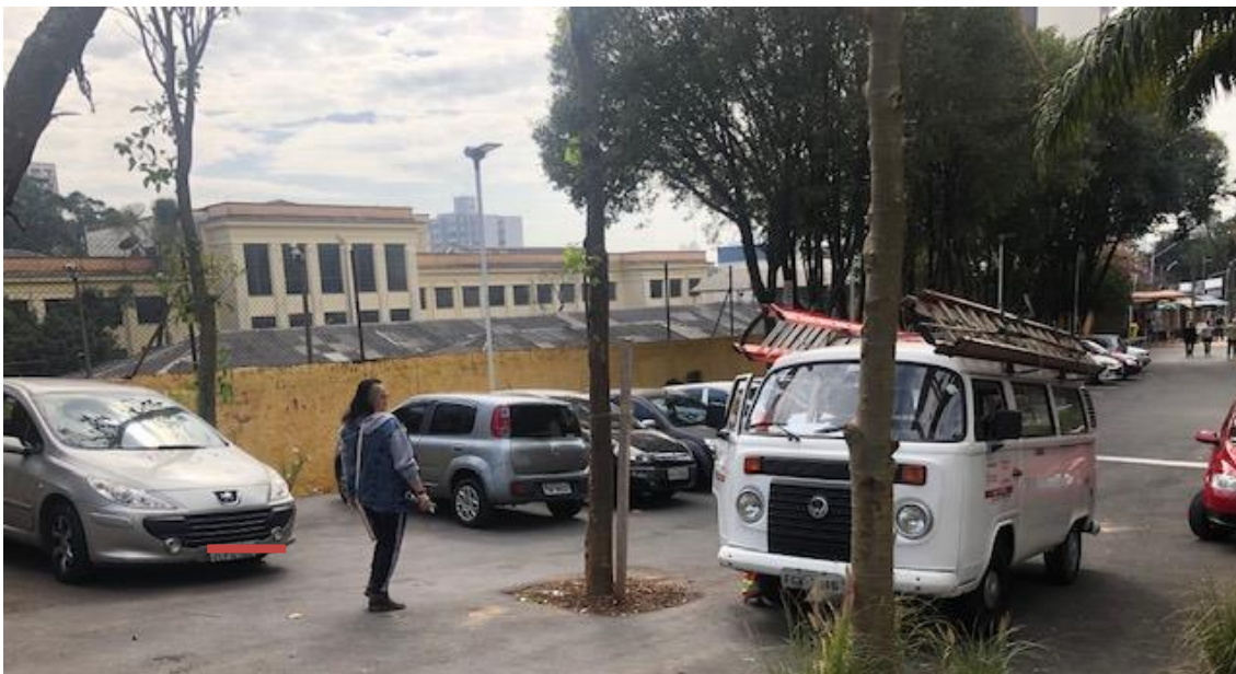
Figura 20 - EE Américo Brasiliense paisagismo da praça IV Centenário.

Cons. Munic. de Defesa do Patrimônio Histórico, Artístico, Arquitetônico-Urbanístico e Paisagístico de Santo André