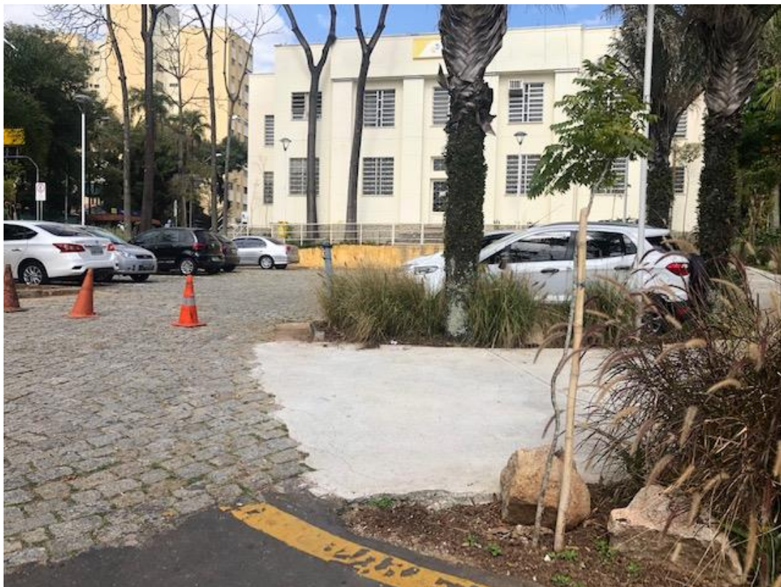
Figura 24 - Área de estacionamento dos Correios, à direita novo acesso para carga e descarga e abaixo asfalto para acesso de veículos sobre a Praça.

Cons. Munic. de Defesa do Patrimônio Histórico, Artístico, Arquitetônico-Urbanístico e Paisagístico de Santo André