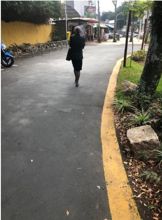
Figura 15 - Vista da praça, bicicletário e bancas.

Cons. Munic. de Defesa do Patrimônio Histórico, Artístico, Arquitetônico-Urbanístico e Paisagístico de Santo André