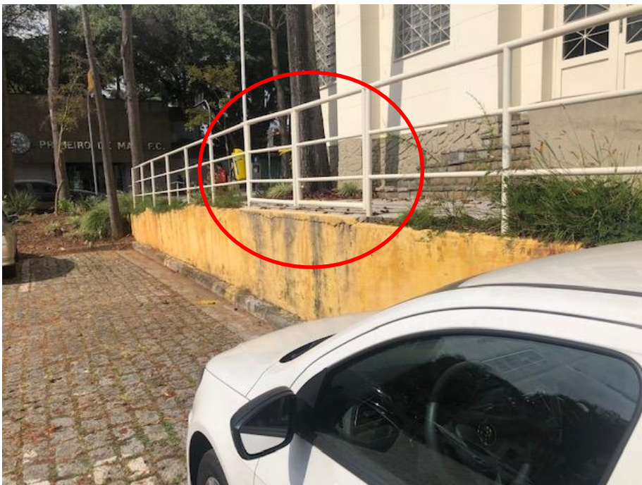
Figura 13 - Portão antes utilizado para carga e descarga dos Correios.

Cons. Munic. de Defesa do Patrimônio Histórico, Artístico, Arquitetônico-Urbanístico e Paisagístico de Santo André