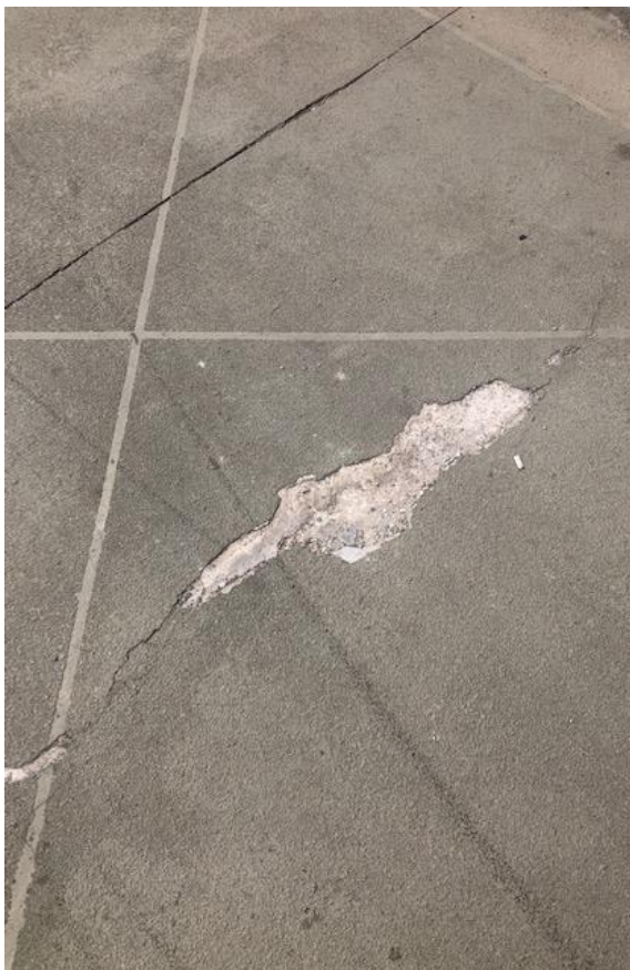
Figura 10 - Camada de revestimento do piso da passarela Luso-brasileira se despregando.

Cons. Munic. de Defesa do Patrimônio Histórico, Artístico, Arquitetônico-Urbanístico e Paisagístico de Santo André