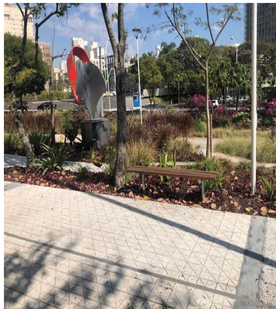
Figura 5 - Escultura Tie no Yoji e paisagismo.