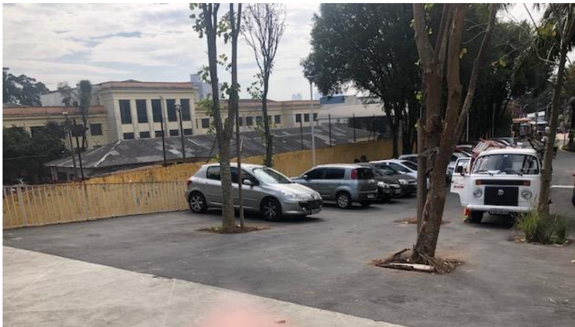
Figura 18 - Veículos estacionados sobre a passarela de pedestres, notar a colocação de asfalto sobre a passarela Luso-brasileira, exclusiva para pedestres, com parte da praça.

Cons. Munic. de Defesa do Patrimônio Histórico, Artístico, Arquitetônico-Urbanístico e Paisagístico de Santo André