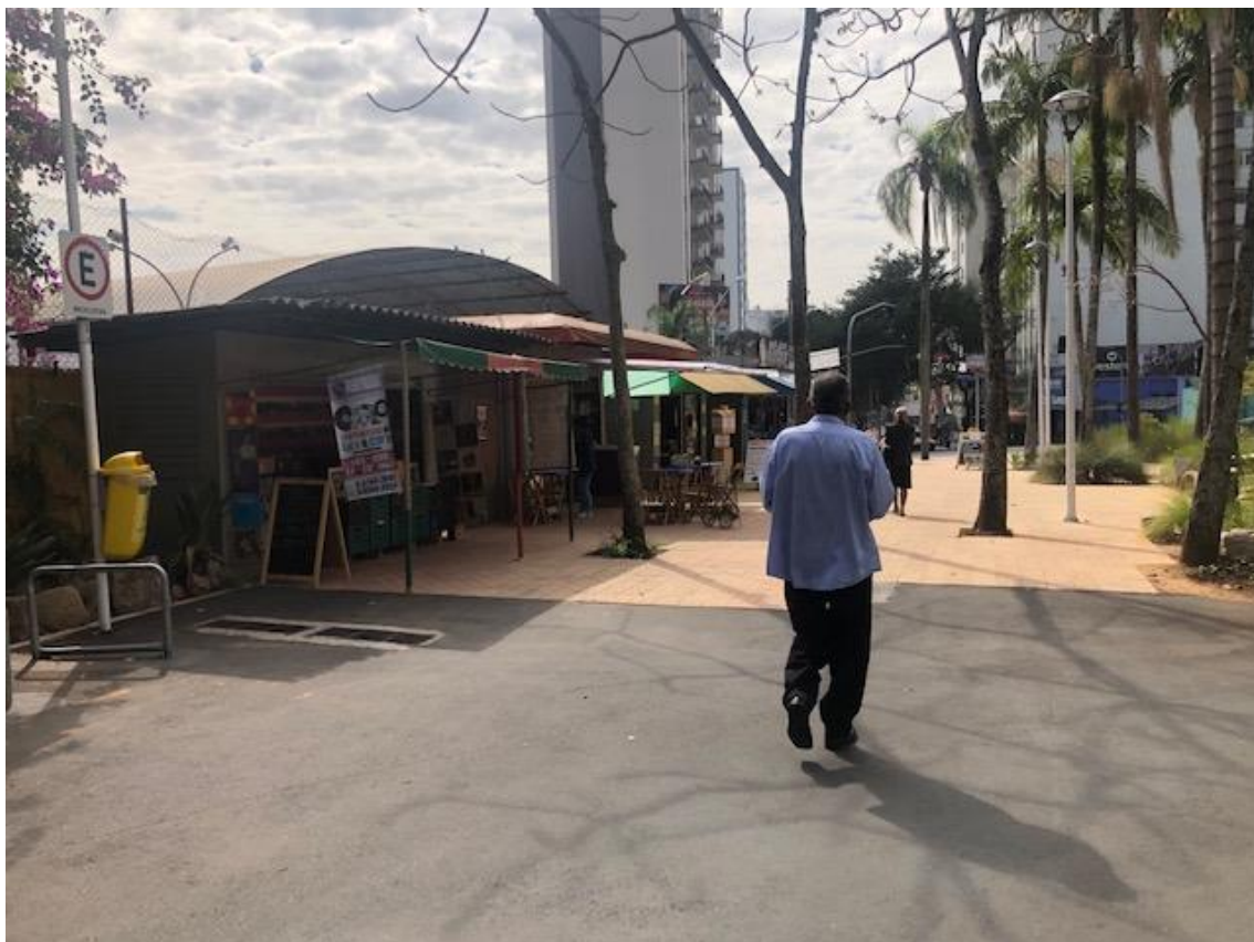
Figura 25 - Acesso entre passarela Luso-brasileira e praça IV Centenário que teve o piso asfaltado para uso de veículos.