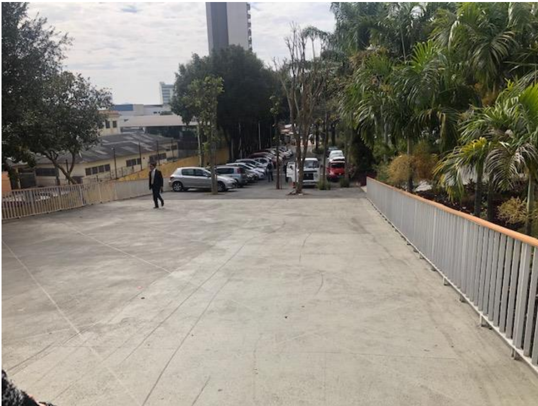
Figura 17 - Vista da passarela e da praça IV Centenário, local indicado para nove vagas, mas na ocasião havia 20 veículos estacionados.