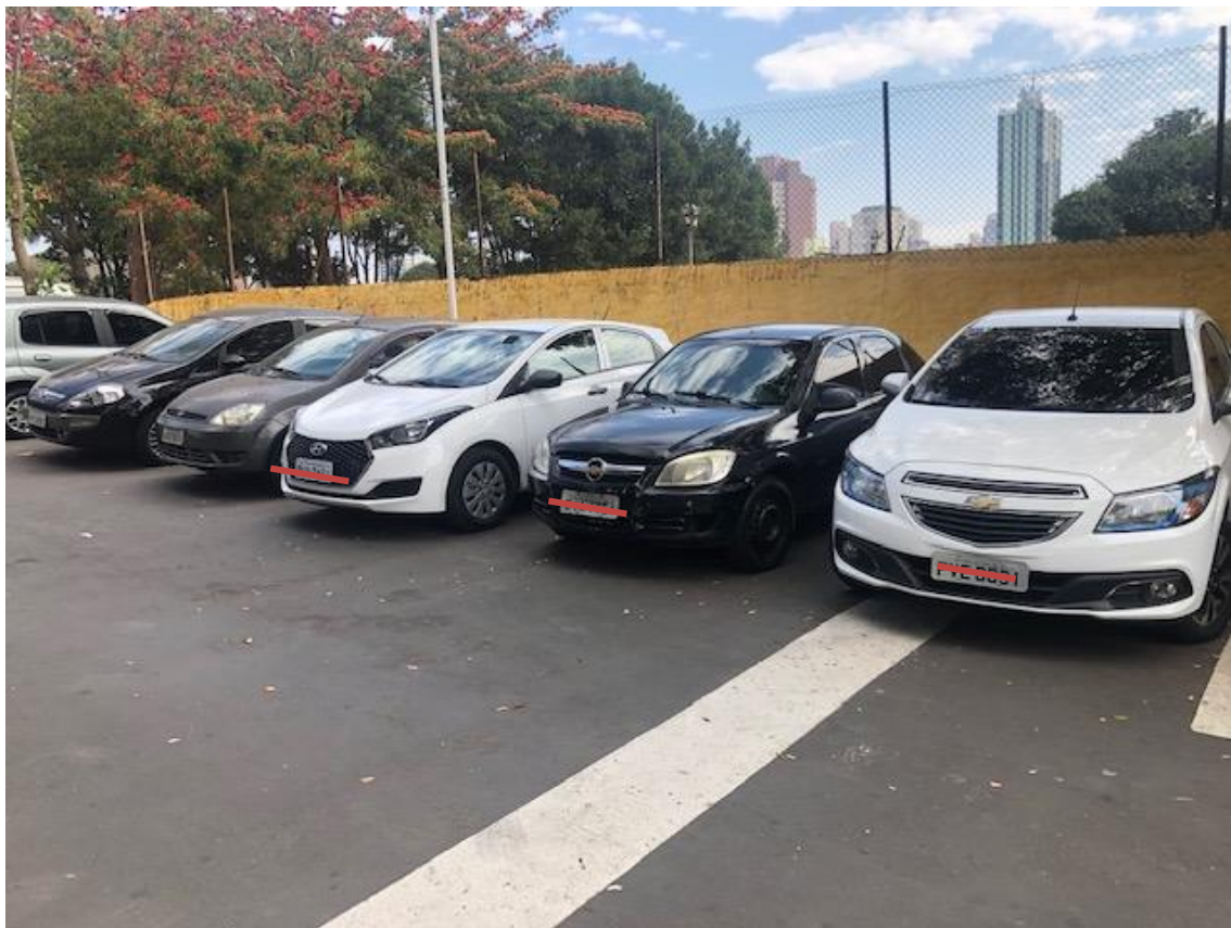
Figura 22 - Veículos estacionados além da área indicada no projeto, na ocasião havia 20 veículos estacionados.

Cons. Munic. de Defesa do Patrimônio Histórico, Artístico, Arquitetônico-Urbanístico e Paisagístico de Santo André