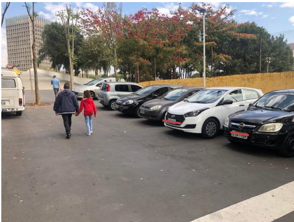
Figura 19 - Veículos estacionados sobre a passarela Luso-brasileira, além da delimitação das nove (9) vagas apresentadas no projeto.