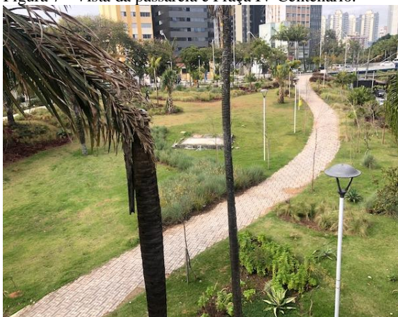
Figura 9 - Vista da praça, com caminho executado e paisagismo.