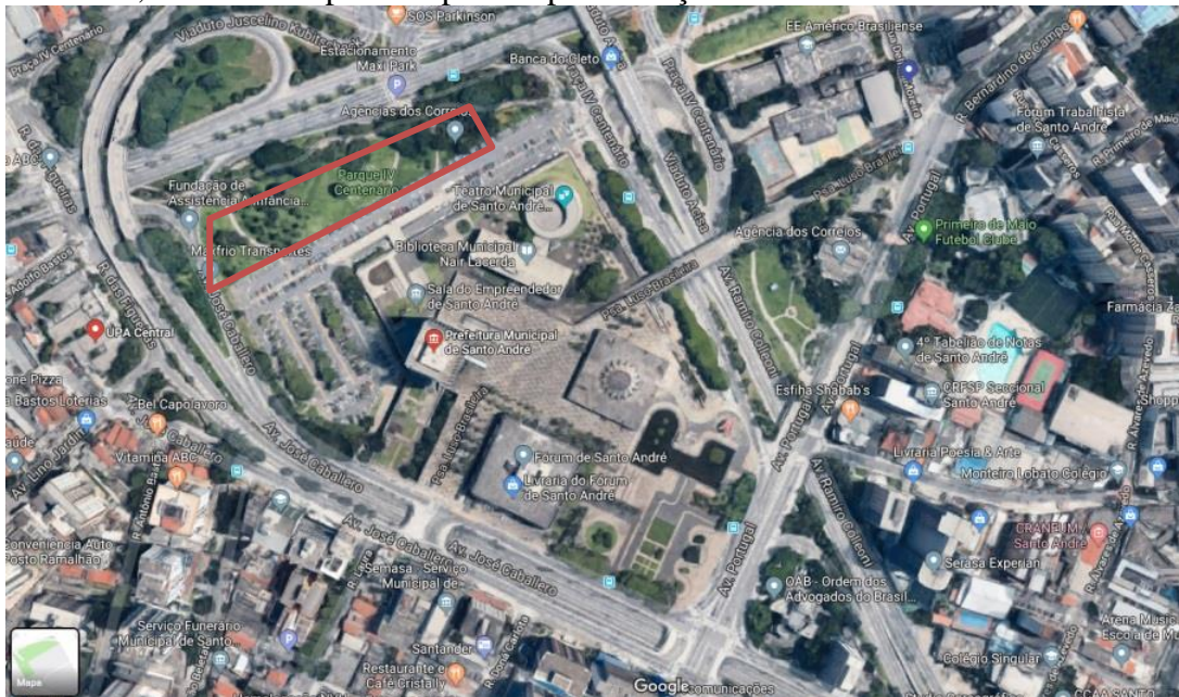
FIGURA 1. Vista aérea do centro de Santo André, destaque para o Centro Cívico e, em vermelho, área a ser suprimida para implementação do estacionamento.