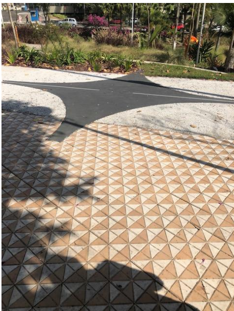
Figura 4 - Marco Zero, absorvido pelo passeio

Cons. Munic. de Defesa do Patrimônio Histórico, Artístico, Arquitetônico-Urbanístico e Paisagístico de Santo André