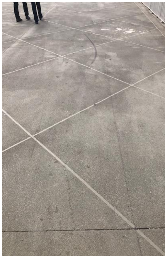
Figura 11 - Camada de revestimento sobre piso da passarela Luso-brasileira.