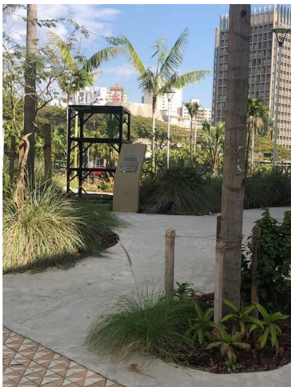
Imagem 3 - Estrutura para colocação da Escultura de João Ramalho, retirada do Centro Cívico.

Seguem imagens de vistoria realizada em 30 de julho p.p.