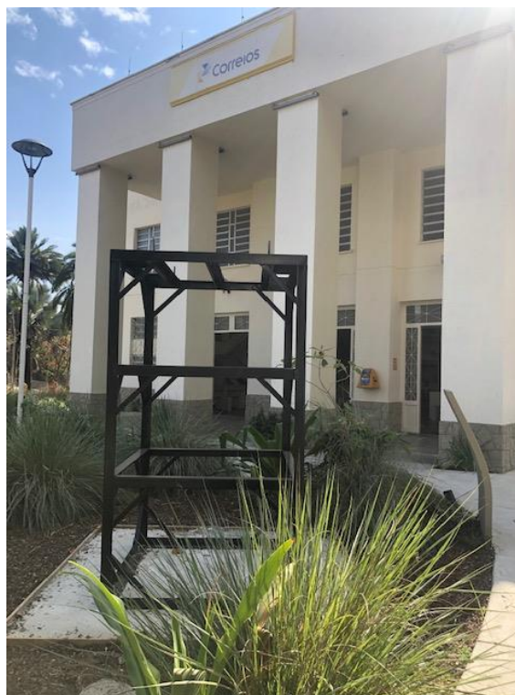
Imagem 2 - Estrutura para instalação da escultura de João Ramalho, notar a altura da estrutura em relação ao edifício tombado, o que interferirá visivelmente na fachada após seu fechamento e a instalação da escultura. Processo 39.800/1999.