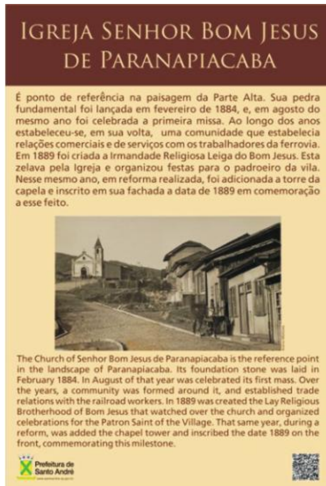
Imagem 4: Padrão de placa para Atrativos Turísticos do PSTVP

Em análise realizada em conjunto com o Arq. Sidnei de Oliveira Ramos, do Departamento de Gestão de Paranapiacaba e Parque Andreense, do material apresentado temos a manifestar que o layout apresentado está de acordo com o Guia Brasileiro de Sinalização Turística, porém não está de acordo com o padrão estabelecido e aprovado para a sinalização da vila. A placa em questão deve seguir o padrão de placas de “Atrativos Turísticos” do Projeto de Sinalização Turística da Vila de Paranapiacaba, conforme imagem 4.