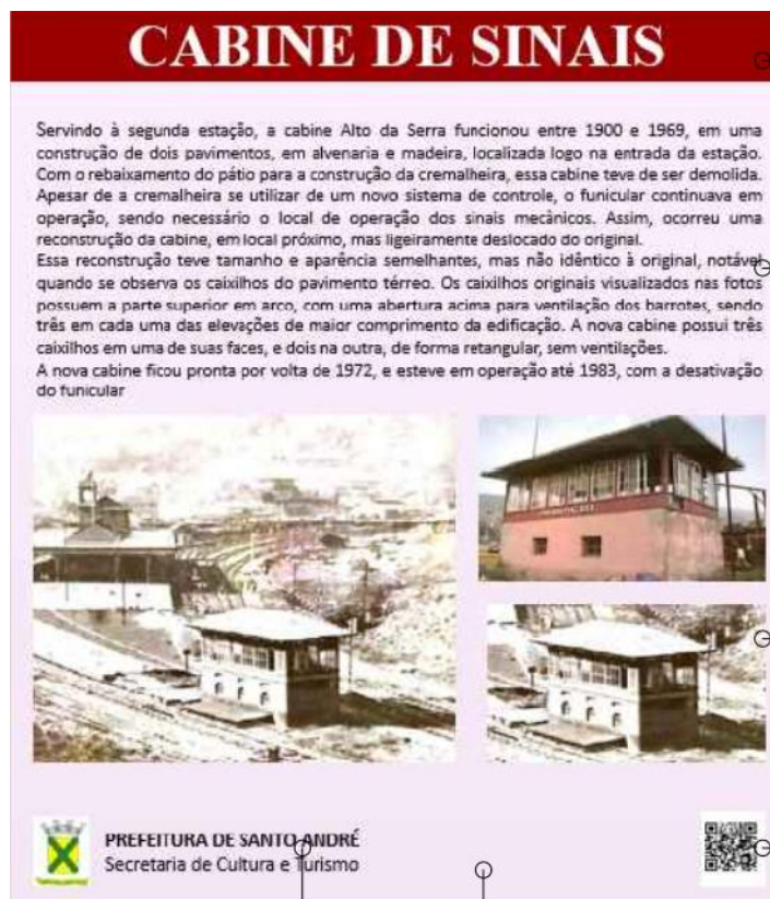
Imagem 1: Layout da placa de sinalização da Cabine de Sinais

Trata-se de solicitação de autorização da MRS Logística para implantação de placa de sinalização no edifício da cabine de Sinais do pátio da Vila de Paranapiacaba, restaurada recentemente.