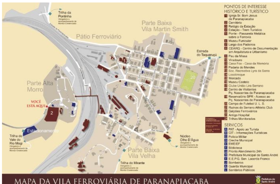
Imagem 5: Mapa dos Pontos de Interesse Histórico e Turístico da Vila de Paranapiacaba

Outra questão é que toda vez que inserida uma nova placa de atrativo turístico sejam atualizados os Mapas de Localização dos Pontos de Interesse Histórico e Turístico da Vila de Paranapiacaba com a inclusão dos novos pontos.