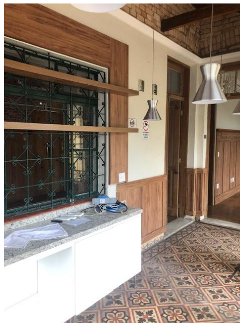
Foto 6 Vista da varanda