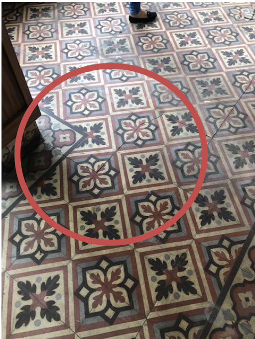
Foto 7 Detalhe do piso da varanda – ladrilho hidráulico com rachadura Foto CT 09/04/19.