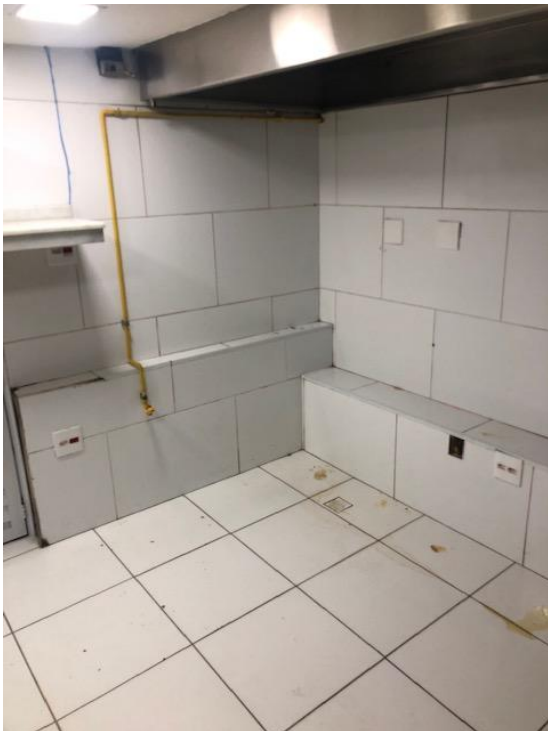
Foto 13 Cozinha instalada no porão na reforma de 2015. Foto CT 09/04/2019.