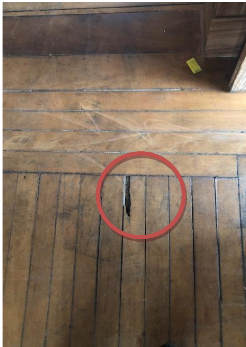
Foto 8 Assoalha com fenda