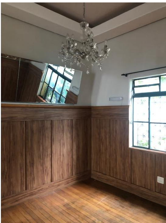
Foto 9 Cômodo dos fundos.