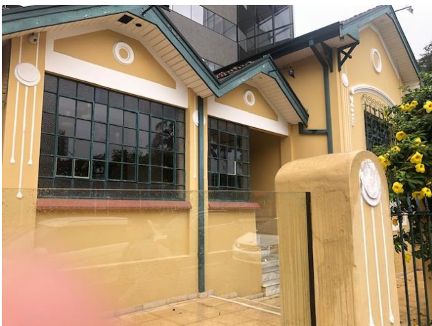
Foto 1 Parte da fachada, lateral esquerda, ao fundo acesso de veículos ao edifício comercial. Foto CT 09/04/2019.

DIRETRIZES ESPECÍFICAS DE PRESERVAÇÃO Volume principal, forma dos telhados, muros e gradis frontais à edificação Escala 1:4.000 - Folha 2/2 Desenho DDP/Nov-2008