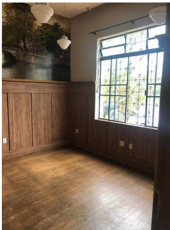
Foto 10 Cômodo da frente.