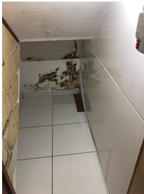
Foto 15 Nicho existente entre a escada e parede dos fundos da casa, notar infiltração. Foto: CT 09/04/2019.