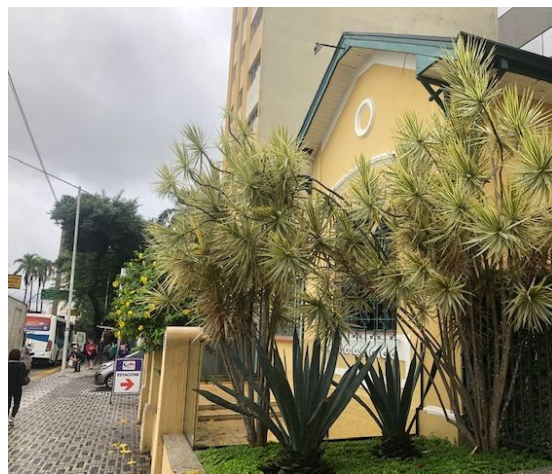
Foto 2 Parte da fachada lateral direita, jardim e fachada frontal. Foto CT 09/04/2019.