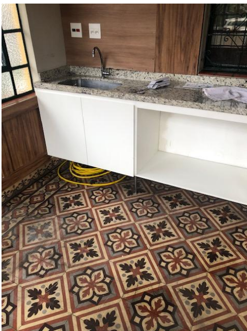
Foto 5 Vista da varanda, foi retirado o balcão e instalada uma pia na última reforma. Foto CT 09/04/19.