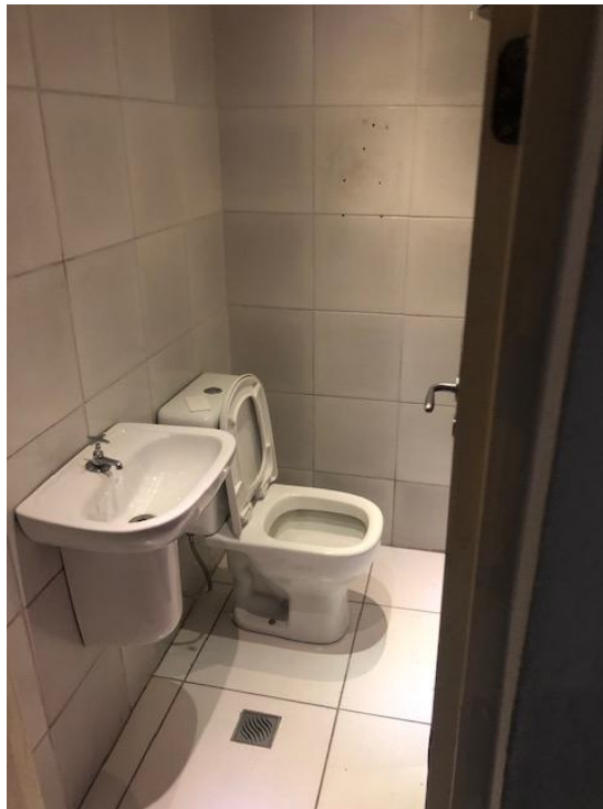
Foto 12 Sanitário instalado no porão 09/04/2019.