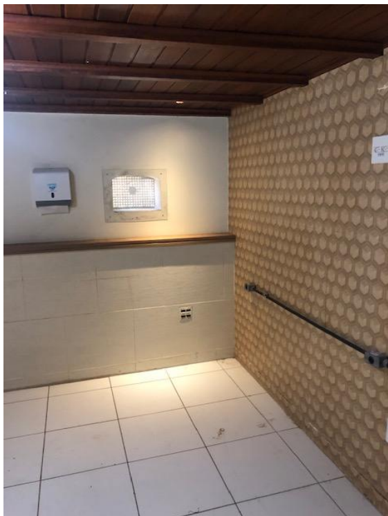
Foto 14 Porão, foi adaptado para abrigar cozinha, sanitários e estar quando da reforma para instalação do bistrô em 2015, notar fechamento do gradil de ventilação do porão. Foto: CT 029/04/2019