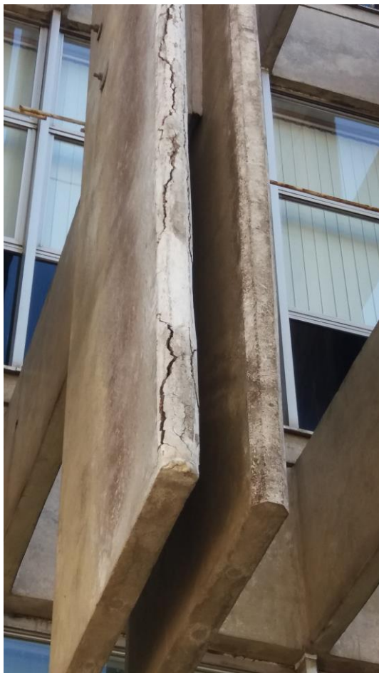
Foto 1. Fissuras e trincas nos brises

Secretaria de Cultura e Turismo Conselho Municipal de Defesa do Patrimônio Histórico, Artístico, Arquitetônico-Urbanístico e Paisagístico de Santo André COMDEPHAAPASA