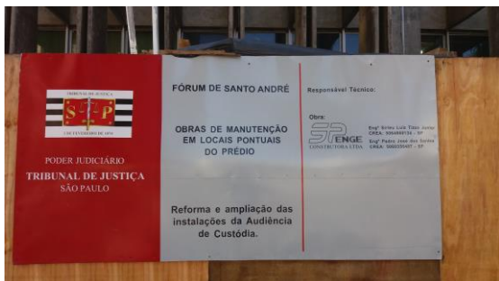
Foto 4. Placa de Obras da empresa SP ENGE

Secretaria de Cultura e Turismo Conselho Municipal de Defesa do Patrimônio Histórico, Artístico, Arquitetônico-Urbanístico e Paisagístico de Santo André COMDEPHAAPASA