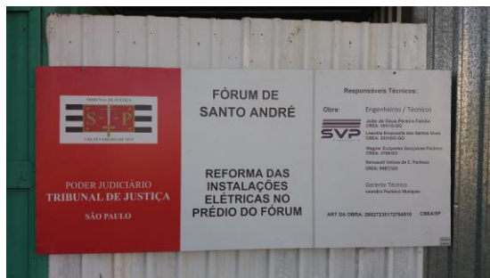
Foto 5. Placa de Obras da empresa SVP

Não obtivemos informações junto à Diretoria de Serviços de Administração Geral do Fórum sobre o cronograma das obras contratadas.