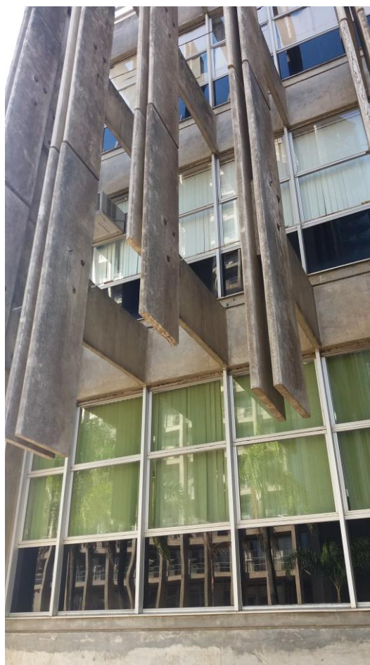
Foto 2. Brises com partes quebradas