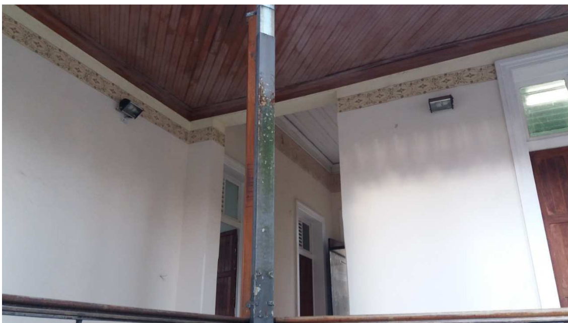
Condutores de águas pluviais enferrujadas e furadas(1)