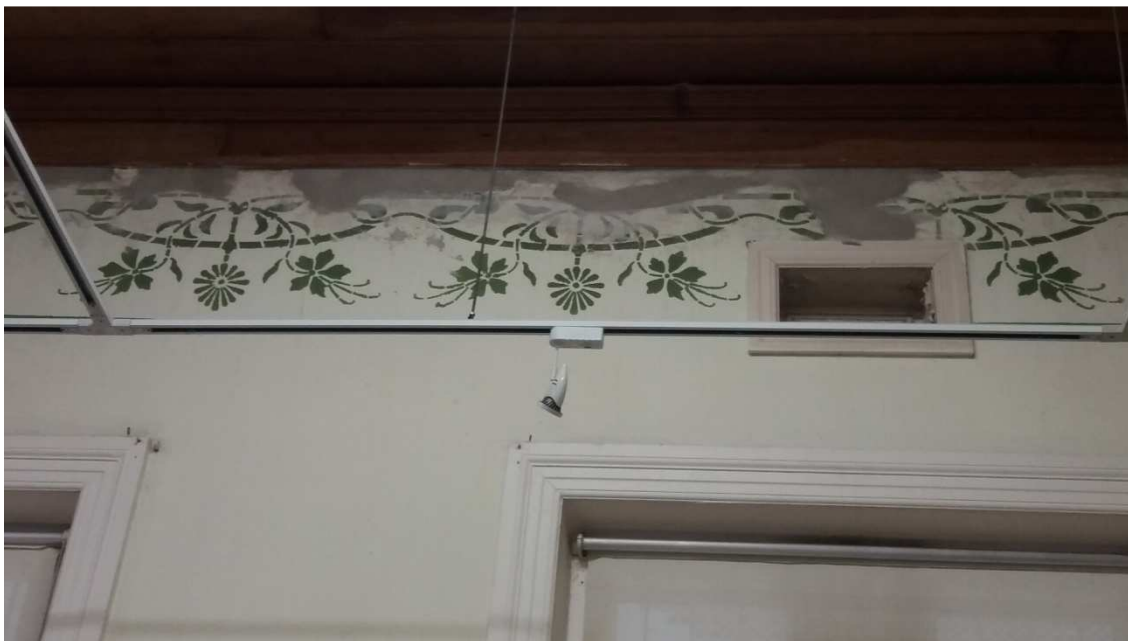
Remendos em argamassa fora dos padrões adequados (5)

Secretaria de Cultura e Lazer Conselho Municipal de Defesa do Patrimônio Histórico, Artístico, Arquitetônico-Urbanístico e Paisagístico de Santo André