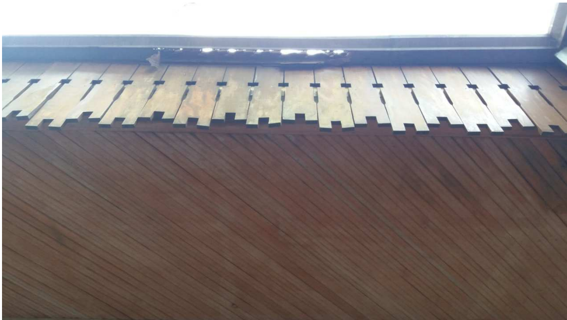
Calhas do telhado enferrujadas e furadas (1)