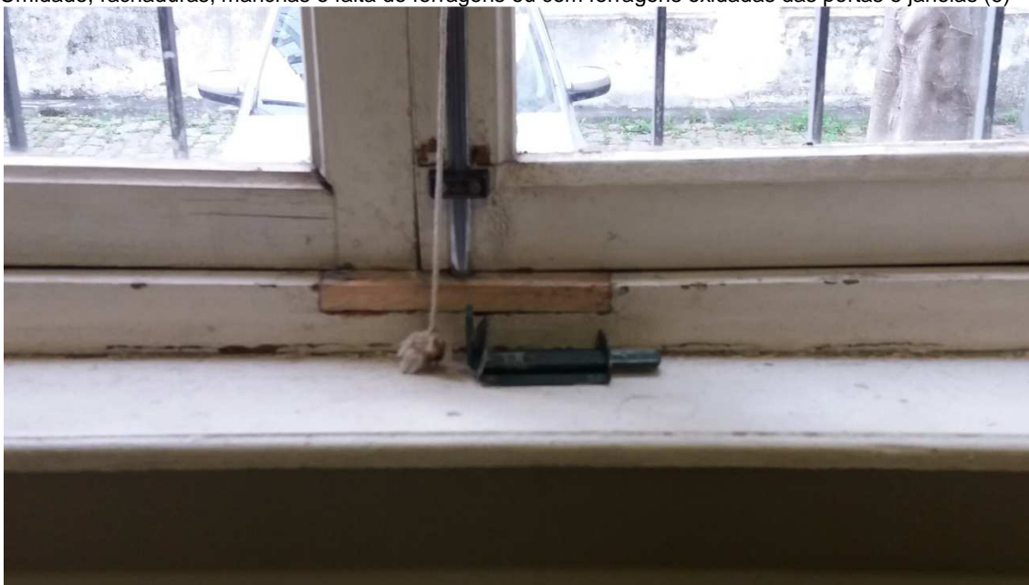
Umidade, rachaduras, manchas e falta de ferragens ou com ferragens oxidadas das portas e janelas (6)