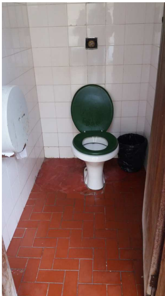
Falta de acessibilidade ao edifício (12) e não adequação dos sanitários às PMR, PCR e PO (13)

Sugestão de encaminhamentos aos departamentos responsáveis para a execução ou a contratação de empresa especializada para realização dos seguintes serviços e obras: