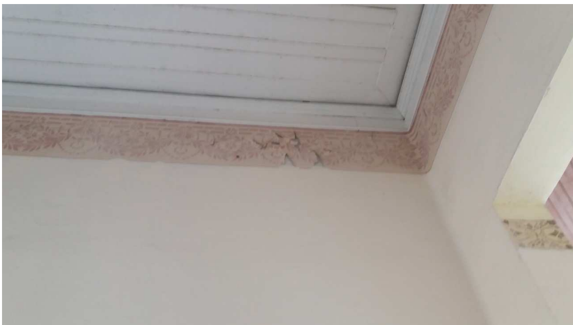
Descascamento e descoloração das pinturas em geral e dos barrados das salas e varandas (8)

Secretaria de Cultura e Lazer Conselho Municipal de Defesa do Patrimônio Histórico, Artístico, Arquitetônico-Urbanístico e Paisagístico de Santo André