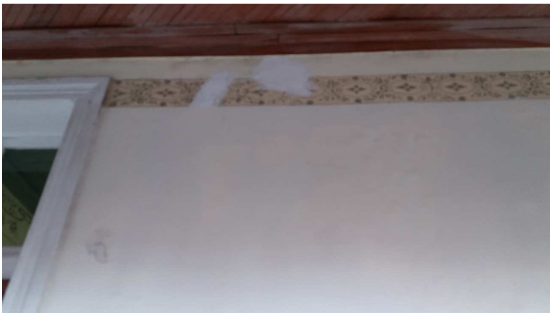
Remendos em argamassa fora dos padrões adequados (5)