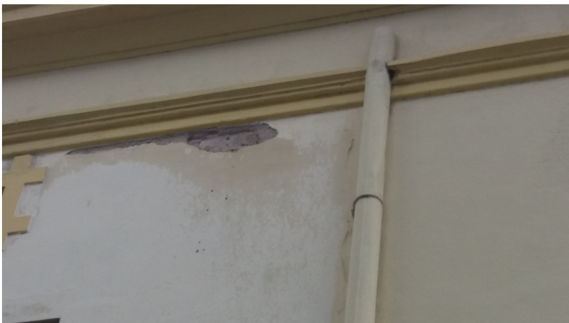
Descolamento de argamassas em função de umidade (1)

Secretaria de Cultura e Lazer Conselho Municipal de Defesa do Patrimônio Histórico, Artístico, Arquitetônico-Urbanístico e Paisagístico de Santo André